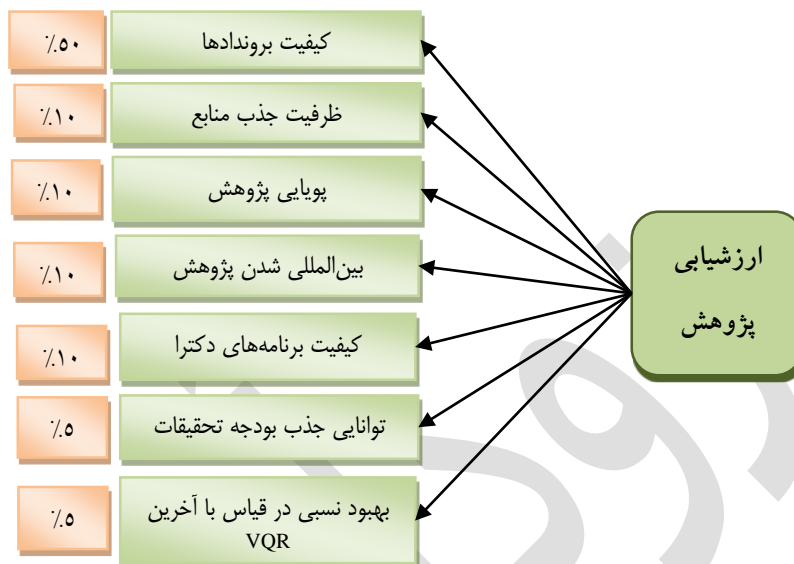
شکل ۲. چارچوب سنجش کیفیت پژوهش در سیستم VQR ایتالیا

پژوهش هیئت علمی (۱۰٪)، بین‌المللی شدن (۱۰٪)، کیفیت برنامه‌های دکترا (۱۰٪)، توانایی جذب بودجه تحقیقاتی (۵٪) و بهبود نسبی در قیاس با آخرین VQR (۵٪).