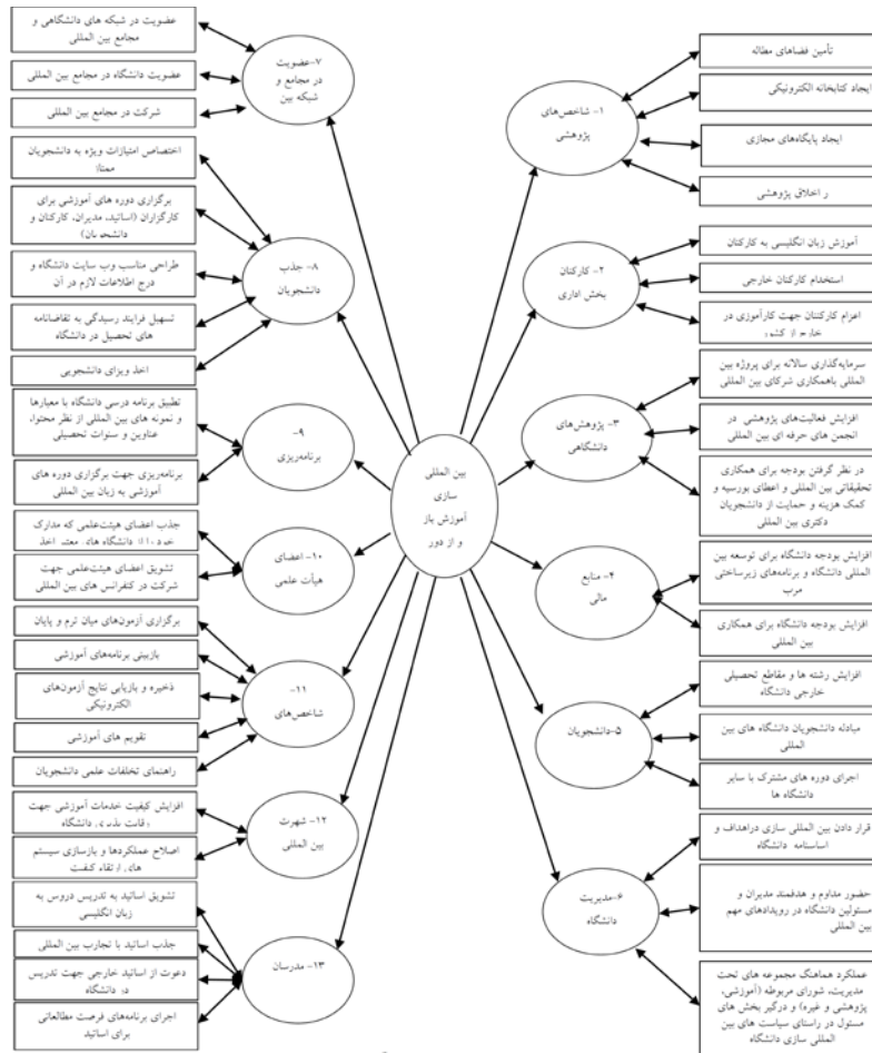
شکل ۲. شاخص‌ها و مؤلفه‌های بین‌المللی سازی آموزش باز و از دور