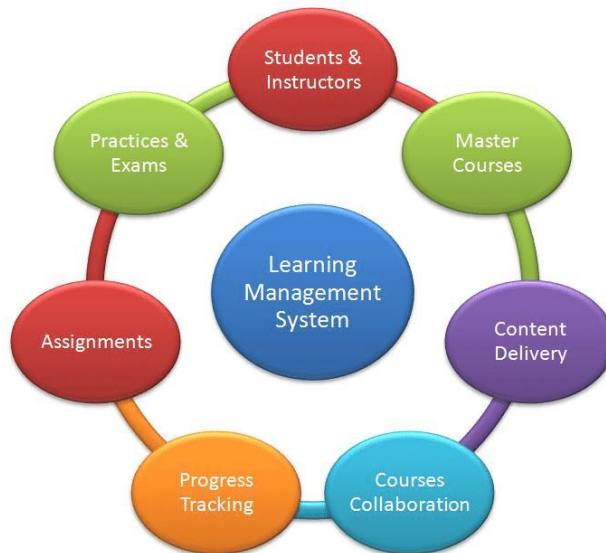
شکل ۱. سیستم مدیریت یادگیری

همچنین این نوع از آموزش انعطاف زیادی در روش‌شناسی آموزشی، مدیریت محتوا، تعامل هم‌زمان و غیر هم‌زمان بین استادان و دانشجویان، سازمان‌دهی و ساختار دوره‌ها، طرح‌های آموزشی و بالاخره ارزیابی دانشجویان به وجود آورده که باعث می‌شود تا فرآیند یادگیری از تمرکز بر آموزش محور به تمرکز بر یادگیری محور تغییر پیدا کند (زاهد بابلان، معینی کیا و درخشان فرد، ۱۳۹۵).