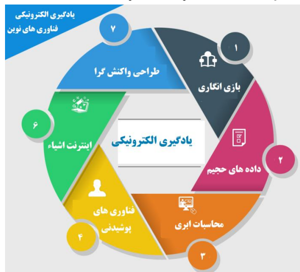
شکل ۴. مدل پیشنهادی فن‌آوری‌های نوین در یادگیری الکترونیکی

اگرچه فن‌آوری چاپ سه‌بعدی در ابتدای مسیر توسعه قرار دارد، اما پیش‌بینی می‌شود که تأثیر آن در چشم‌انداز یادگیری و آموزش، به‌ویژه آموزش الکترونیکی شدید و قدرتمند باشد. چاپگرهای چاپ سه‌بعدی، برای دانشجویان و دانش‌آموزان امکانات بیشتری برای تجربه‌های عملی قدرتمند ارائه می‌دهند و همچنین تفکر خلاق خود را ارتقا می‌دهند. این فن‌آوری برای کمک به یادگیری‌هایی همچون شبیه‌سازی ساختمان، سد، پل، خودرو و بسیاری موارد دیگر، امکانات و تجربه بسیار جذاب و مفیدی برای یادگیرندگان را فراهم می‌کند. این فن‌آوری به‌اندازه‌ی کافی قدرتمند است که بتواند یادگیری پویا دانشجویان را در آینده نزدیک تغییر دهد.