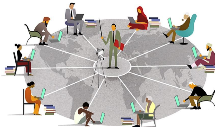
شکل ۳. برگزاری دوره‌های آزاد انبوه برخط با شرکت کنندگانی از تمام نقاط جهان

طراحی آموزش الکترونیکی واکنش گرا، مفهومی است که در دنیای جدید یادگیری که آموزش‌گیرندگان بیشتر وقت خود را در مقابل چندین صفحه‌نمایش اعم از رایانه، لپ‌تاپ، تلفن هوشمند و غیره صرف می‌کنند، مطرح شده است. طبق یکی از گزارش‌های موتور جستجوی گوگل ۹۰ درصد از تعاملات رسانه‌های مبتنی بر صفحه‌نمایش است.