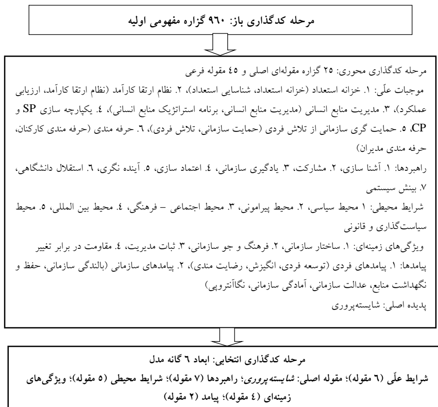
شکل ۱. فرآیند مدیریت داده‌ها و تکامل مدل در سه مرحله کدگذاری

شامل پیامدهای فردی، پیامدهای سازمانی) جای گرفتند. شکل ۱ فرآیند مدیریت داده‌ها و تکامل مدل در سه مرحله کدگذاری (باز، محوری و گزینشی) را نشان می‌دهد.