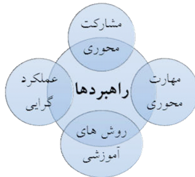
شکل ۵. مقوله محوری راهبردها و زیر مقوله‌های آن

راهبرد عنوان مقوله محوری و اساسی دیگر است که از دل مصاحبه‌های انجام شده در این پژوهش استخراج شده است. هر سازمانی باید در زمینه ۴ یا شرایط خاص خودش برای رسیدن به اهداف خود دارای راهبردها یا روش‌های خاص باشد که این راهبردها بیان می‌کنند که سازمان مورد نظر چگونه به اهداف دست پیدا خواهد کرد. در پژوهش حاضر نیز سازمان آموزش و پرورش استان می‌تواند با استفاده از راهبردهایی که این الگو ارائه کرده است به اهداف مورد نظر خود دست پیدا کند. مقوله محوری راهبرد دارای زیر مقوله‌های مشارکت محوری، مهارت محوری، روش‌های آموزشی و عملکرد گرایبی است. مقوله مشارکت محوری شامل زیر مقوله‌های کارگروهی، همکاری و مشارکت، مدیریت تیمی و مشارکتی، تصمیم‌گیری‌های مشارکتی در سطوح بالا و پایین سازمان، مشارکت دانش آموزان در اداره و تصمیم‌گیری‌های سازمان است. این مقوله در همه مصاحبه‌های انجام شده مورد تاکید قرار گرفته است و بیان شده است که اگر تصمیمات سازمان بر اساس سلیقه یک نفر باشد آن سازمان موفقیت چندانی به دست نخواهد آورد اگر قوانین و شرایط اداری را افراد سازمان بصورت گروهی تعیین کنند خودشان دارای انگیزه زیاد بوده و دارای احساس تعلق خواهند بود. مقوله مهارت محوری، مقوله دیگری است که در مقوله محوری راهبرد، جای گرفته است. این مقوله شامل زیر مقوله‌های ارتباط محتوای درس با زندگی واقعی یادگیرندگان، آموزش چگونه زیستن، آموزش بهداشت شخصی، آموزش تفکر سیستمی، مهارت‌های تفکر