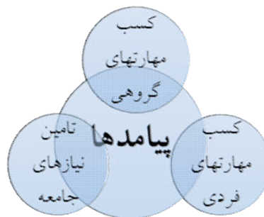
شکل ۶. مقوله محوری پیامدها و اهداف و زیر مقوله‌های آن

انتقادی، مهارت‌های تفکر خلاقانه، مهارت‌های تفکر حل مسئله است. مقوله روش‌های آموزشی، مقوله‌ای است که امروزه در تعیین موفقیت سیستم‌های آموزشی دنیا نقش بسیار مهمی ایفا می‌کند. مقوله روش‌های آموزشی شامل: بکارگیری فناوری‌ها، استفاده از منابع متنوع آموزشی، استفاده از محیط‌های متنوع آموزش و یادگیری، روش‌های پژوهشگری محور، روش‌های یادگیری عمیق، دانش آموز محوری، استفاده از فعالیت‌های شاد و جذاب و استفاده از تفریح را شامل می‌شود. انتخاب روش‌های آموزشی مناسب در ایجاد انگیزه و نحوه و میزان یادگیری در دانش آموزان بسیار مهم است. مقوله عملکردگرایی مقوله مهم دیگری در مقوله محوری راهبرد است. این مقوله محوری بیشتر به تعیین کننده بودن توانایی در انتخاب‌ها برای سمت‌های مختلف و ارزشیابی مناسب از عملکرد است؛ که شامل زیر مقوله‌های نظم‌گرایی، قانون‌گرایی، تخصص‌گرایی، شایسته‌سالاری، نظارت مستمر بر عملکرد، تعیین معیارهای دقیق و شفاف ارزیابی عملکرد، استفاده از تشویق در بهبود عملکرد، ارزشیابی عملکرد و خودارزیابی است.