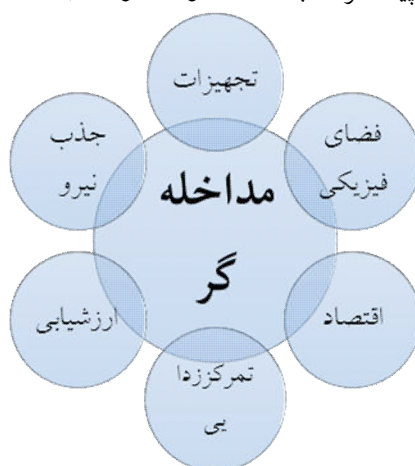
شکل ۳. مقوله محوری عوامل مداخله‌گر و زیر مقوله‌های آن

چنانکه ذکر شد کدگذاری محوری، فرآیند ربط دهی مقوله‌ها به زیر مقوله‌هایشان و پیوند دادن مقوله‌ها در سطح ویژگیها و ابعاد است. این مقوله محوری دارای زیرمقوله‌های کیفیت گرایی، آینده نگری و تأمین نیازهای جامعه است؛ که هر کدام از این مقوله‌ها نیز شامل زیر مقوله‌هایی می‌باشند. مقوله کیفیت گرایی شامل توجه به بعد کیفی در هر سطح و در هر چیزی در سازمان و فرهنگ مشتری مداری است. مقوله آینده نگری شامل بحث‌های مبط به جهانی‌شدن و اثرات آن بر سیستم‌های آموزشی و شامل نگاه به شرایط زندگی برای سازمان بویژه برای دانش آموزان است. مقوله نیاز جامعه نیز شامل دست پیدا کردن به اهداف و انتظارات جامعه است.