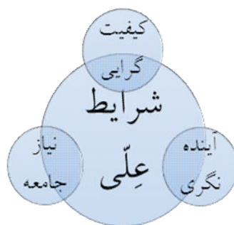
شکل ۲. مقوله محوری شرایط علی و زیر مقوله‌های آن

یافته‌های حاصل از کد گذاری باز در قالب جدول و مولفه های پارا دائم کد گذاری محوری در زیرارائه شده‌اند سپس هر یک از مفاهیم و سازه ها به دست آمده و سیر پژوهش توصیف و تشریح شده است. در کدگذاری محوری با ایجاد پیوند میان مقوله‌ها و در پی آن میان مفاهیم و داده‌ها، مقوله‌های اصلی و فرعی نمایان شدند؛ بدین شکل که یک مقوله در محور تحلیل قرار گرفته و کدگذاری مبتنی بر آن شکل گرفت. به بیان دیگر کدگذاری محوری، فرآیند ربط دهی مقوله‌ها به زیر مقوله‌هایشان و پیوند دادن مقوله‌ها در سطح ویژگی‌ها و ابعاد است. در ادامه مقوله‌های محوری و زیر مقوله‌هایشان نمایش داده شده است.