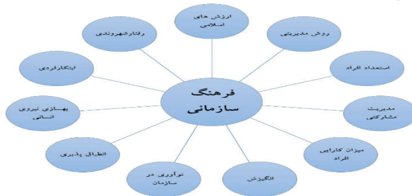
شکل ۱. چارچوب نظری تحقیق

مدل‌های متفاوتی برای فرهنگ‌سازمانی وجود دارد از جمله ویلیام اوچی، پیترز، الگوی پارسونز، ادگار شاین، الگوی دیل و کندی، چارلز هندی که این مدل‌ها به معیارهای مختلفی اشاره نموده‌اند. از آن جمله می‌توان به استعداد افراد، مدیریت مشارکتی، ارزش‌های سازمان، رفتار شهروندی، میزان کارایی، انگیزش، نوآوری، انطباق-پذیری، بهسازی نیروی انسانی و ابتکار فردی اشاره نمود که در چهارچوب زیر به مدل‌هایی که بیشتر تکرار شده نشان داده شده است.